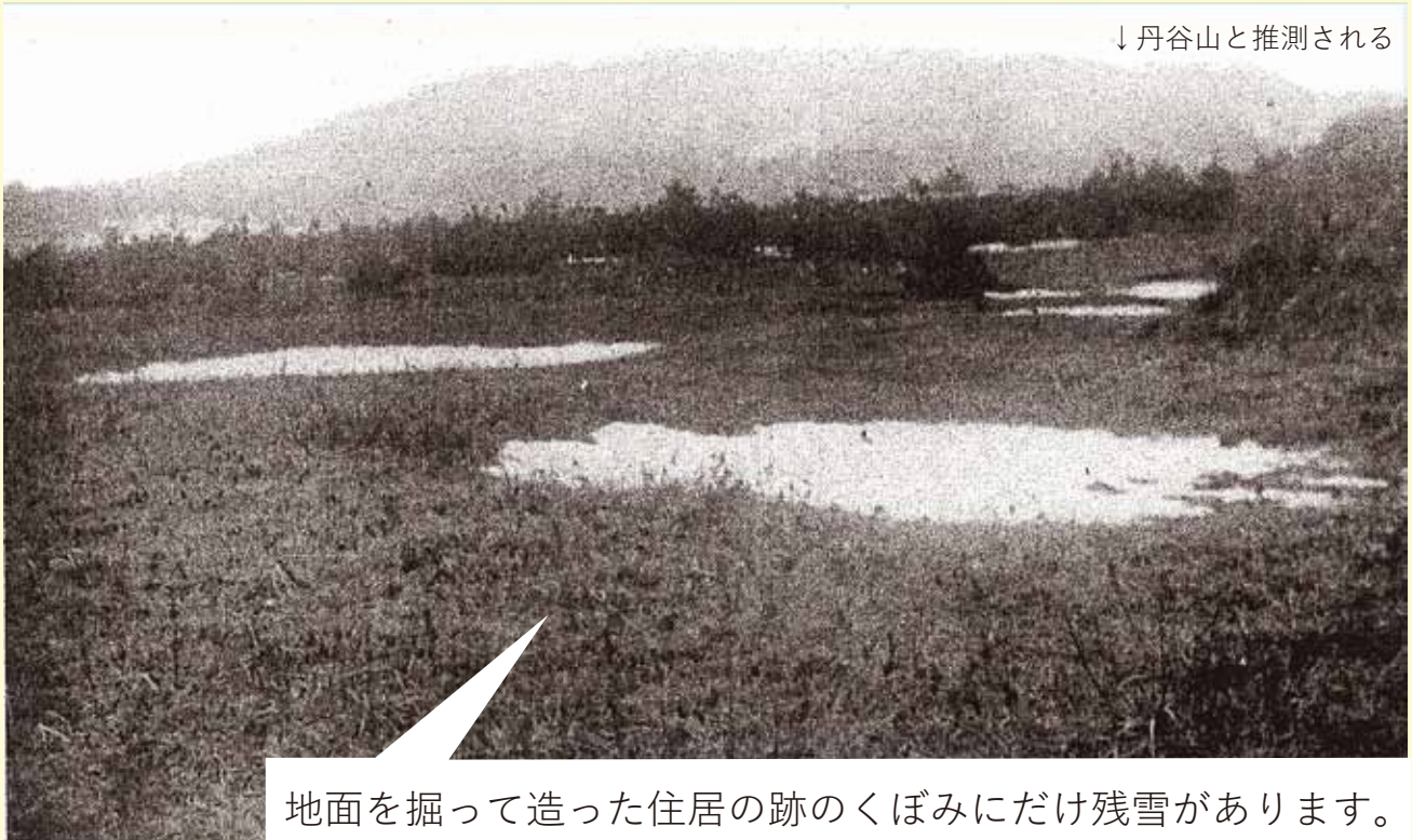
↓丹谷山と推測される