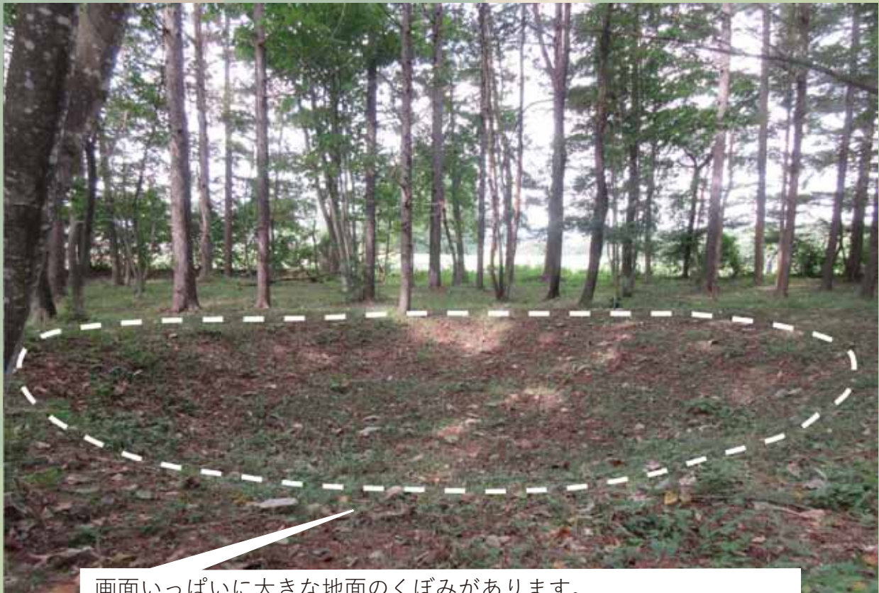
今松遺跡住居跡近景

画面いっぱい大きな地面のくぼみがあります。 幅5～6m、大きいもので幅8～10mのものもあるかもしれません。